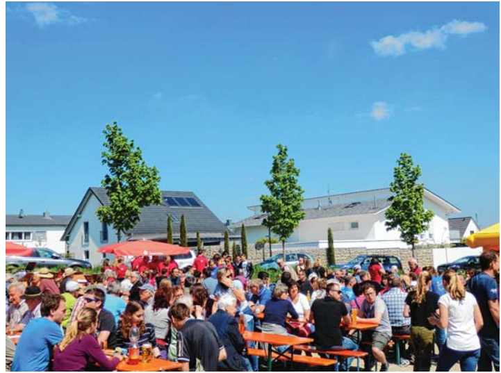
Bestens bewirtet wurden die Besucher, Wanderer und Radfahrer von den Musikerinnen und Musikern des MV Anselfingen.