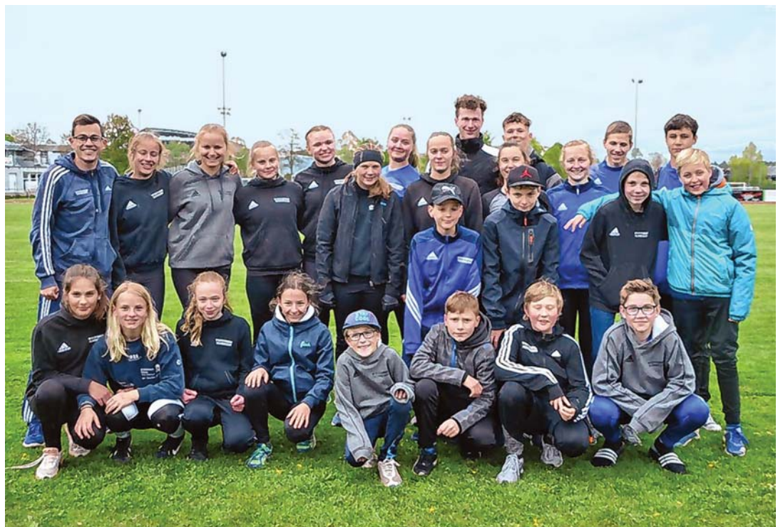
Mit über 30 Teilnehmern stellte der TV Engen die meisten Athleten bei der Bahneröffnung im Hegaustadion.