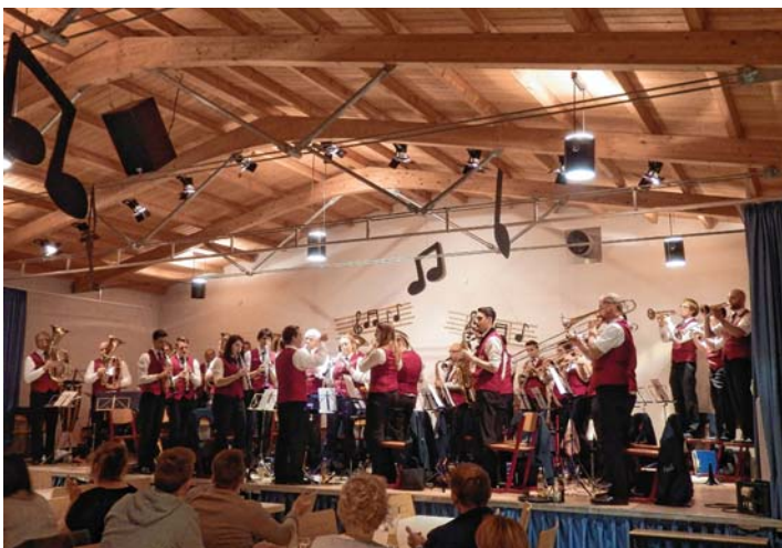
Zu den Musikvereinen, die beim Maibaumstellen und dem Maifest des MV Anselfingen für beste Stimmung sorgten, zählte auch der Musikverein Wolterdingen.

Preise: In allen Klassen werden vom ersten bis dritten Platz Pokale ausgegeben. Die Jugendlichen erhalten auf den weiteren Plätzen Medaillen.